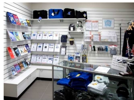
パイロットショップ